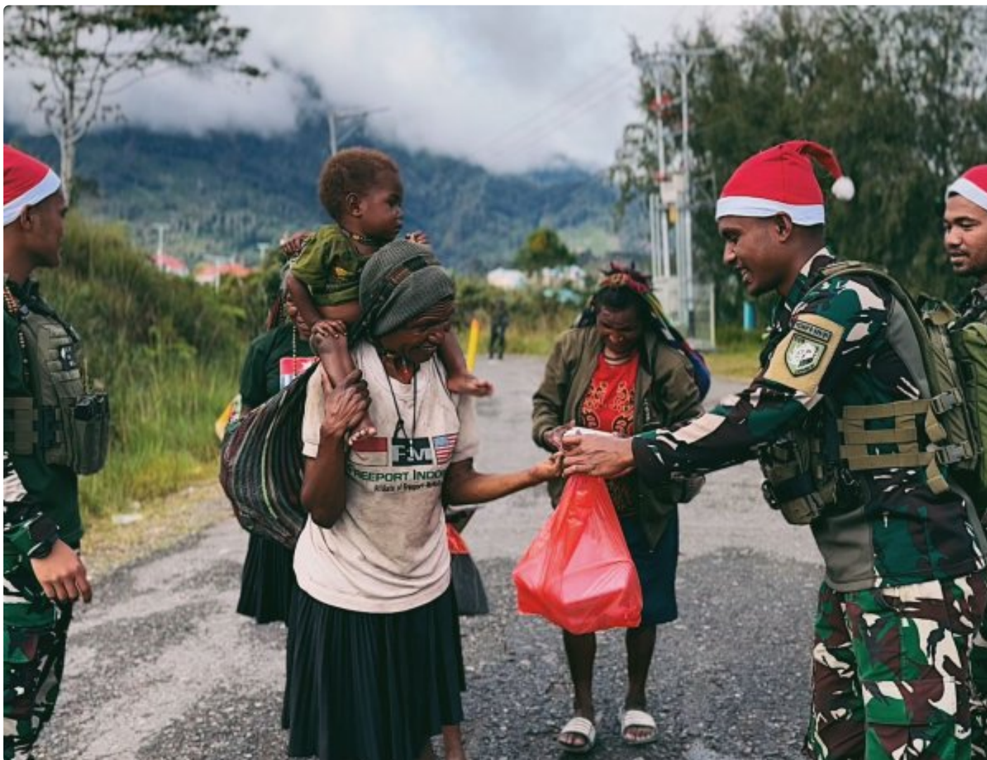
Foto: Satgas Yonif 509 Kostrad memberikan makna baru pada patroli keamanan dengan berbagi kebahagiaan bersama masyarakat di Intan Jaya, Papua.

PAPUA- Dalam balutan semangat Natal yang damai, Satgas Yonif 509 Kostrad