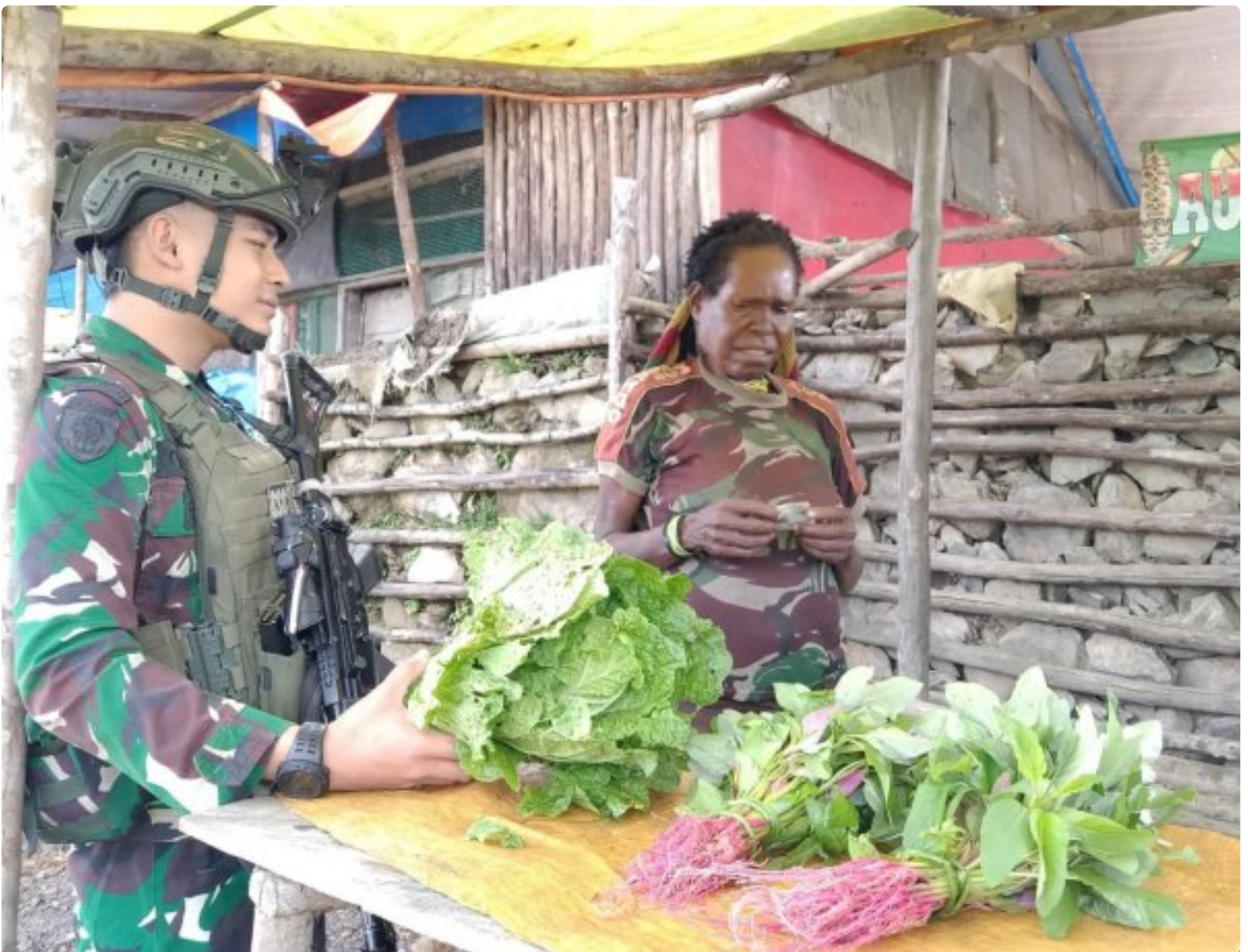
Prajurit TK Pintu Jawa Satgas Mobile Yonif 323/Buaya Putih Memborong hasil Tani mama Papua yang dijual di TK Pintu Jawa

Satgas Pamtas Mobile Yonif 323 Buaya Putih Kostrad TK Pintu Jawa melaksanakan kegiatan ROSITA, kegiatan ini bertujuan untuk membeli hasil tani dari Mama-mama Papua yang datang ke TK Pintu Jawa sebagai wujud saling